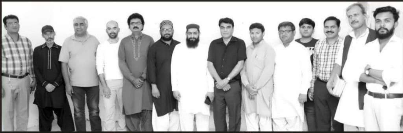
لاہور: غیث و بلیفیر اینڈ ایجوکیشنل ٹرسٹ کی جانب سے افطار ڈنر میں شریک شرکاء کا گروپ فوٹو