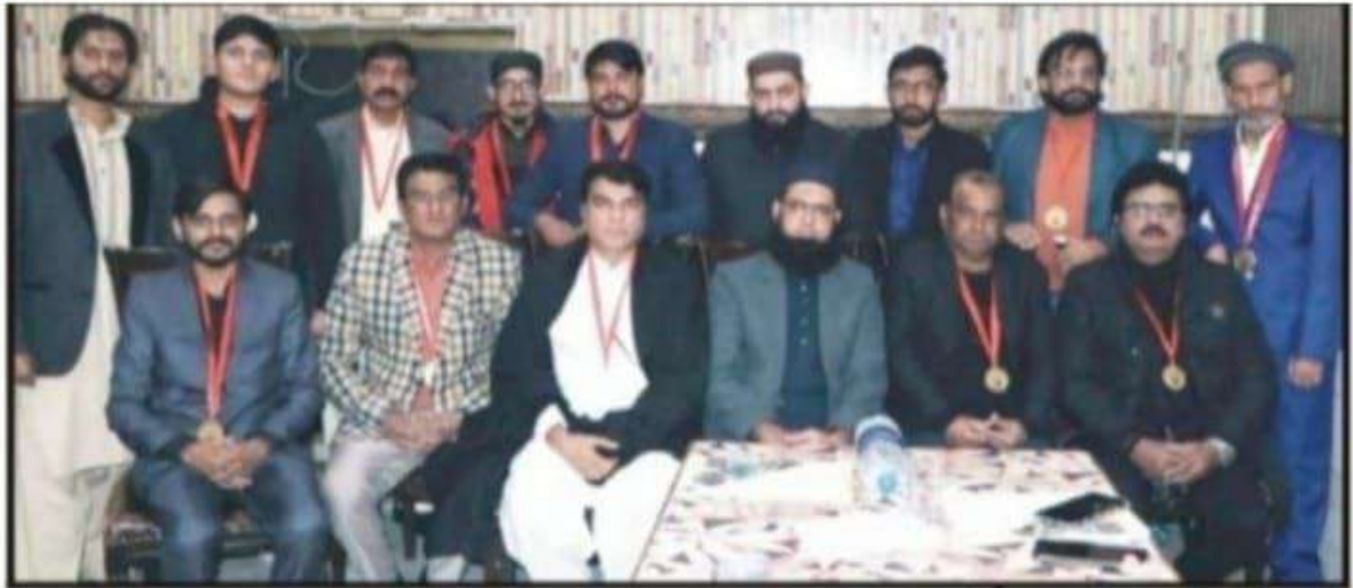
غیث ویلفیئر اینڈ ایجوکیشنل ٹرسٹ کے 11 ویں یوم تاسیس کی تقریب میں شرکاء کا گروپ فوٹو