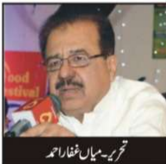
تحریر: میاں شفا احمد

تعلیمات کیا ہیں۔ کئی سال پہلے ایک صدقہ رپورٹ شائع ہوئی جس میں انکشاف کیا گیا تھا کہ صیالی مشنری اداروں نے سائیکوٹ کے ہاؤس کے علاقوں میں بہت سے ایسے لوگوں کو صیالی بنا دیا ہے جس کو امامی دین کے علاوہ ضروریات زندگی کی اشیاء دی گئیں اور وہ دین اسلام سے تائب ہو کر صیالی ہو گئے۔ میں نے جب جو معلومات لی تھیں ان کے مطابق انہیں جہالت کی وجہ سے دین ہارے کوئی