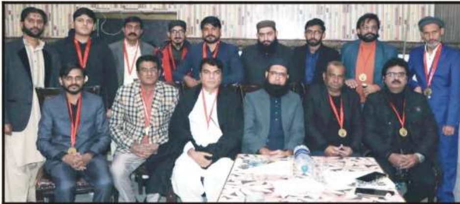
غیث و بلیفیر اینڈ ایجو کیشنل ٹرسٹ کے 11 ویں یوم تاسیس کی تقریب میں شرکاء کا گروپ فوٹو

غیث و بلیفیر اینڈ ایجو کیشنل ٹرسٹ کا 11 واں یوم تاسیس